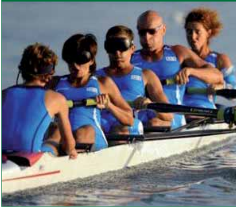
L'equipaggio del "4+ misto" oro a Pechino 2008.