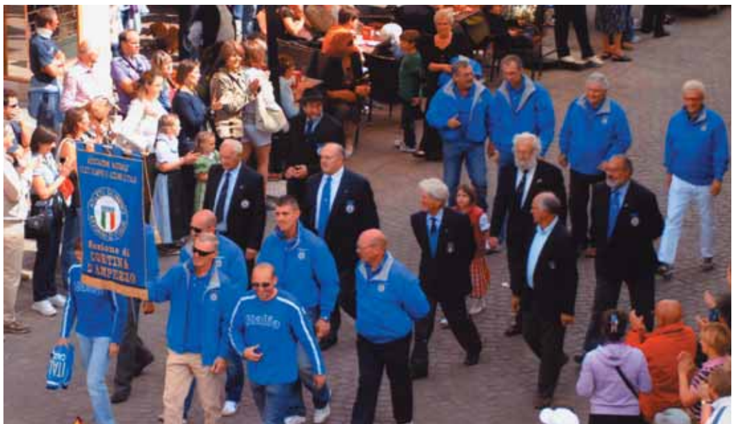
Cortina, Arriva il Labaro della Sezione debitamente scortato ed applaudito.