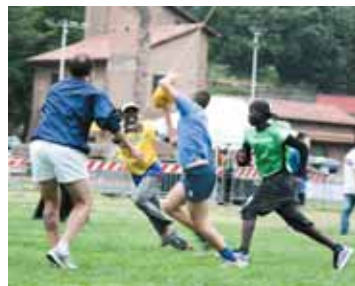
5 giugno 2011. Immagini dall'evento Identità e Incontro nell'ambito della Giornata Nazionale dello Sport.