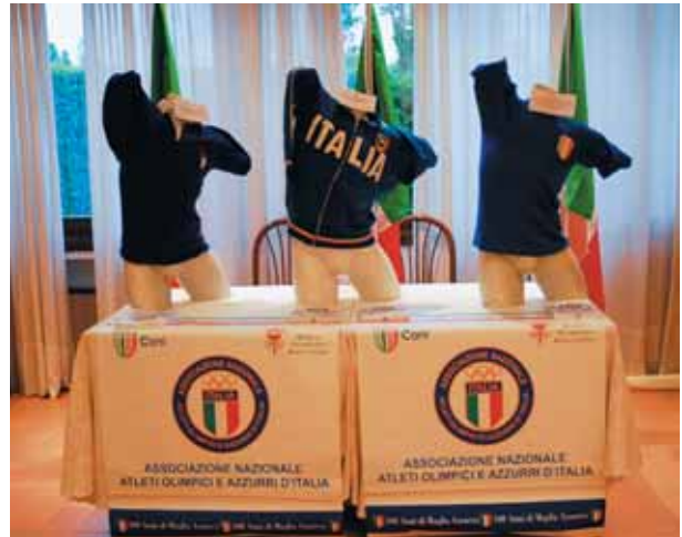
Padova. Maglie Azzurre d'epoca esposte per l'occasione.