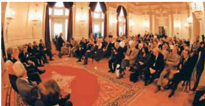
Panoramica del Salone d'Onore della Prefettura.