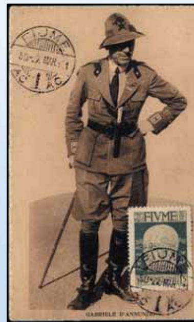
Gabriele D’Annunzio

A conferma della Maglia Azzurra, quale simbolo dell’Italia, concludiamo con un evento pressoché sconosciuto. La storia italiana registra l’impresa di Gabriele D’Annunzio che nel 1919, partendo da Ronchi, divenuta poi “dei Legionari”, andò ad occupare la città e Provincia di Fiume, che il trattato di Parigi 1918, dopo la fine della prima Guerra Mondiale, aveva lasciato al neo-costituito Stato della Jugoslavia. D’Annunzio così costituì la “Reggenza di Carnaro”, contro la volontà dell’Italia ufficiale. Tra le tante attività fu curato anche lo sport, segnatamente calcio e canottaggio, e nel 1920 furono disputate due partite amichevoli tra le “teste di cuoio” di D’Annunzio ed una rappresentativa di calciatori delle cinque squadre fiumane di allora (Leonida, Cantrida, Enea, Gloria e Fiumana). Per amore verso l’Italia D’Annunzio volle che i Legionari indossassero la Maglia Azzurra, ma al posto dello stemma dei Savoia fece applicare sulla maglia uno scudetto tricolore in verticale che, secondo la terminologia araldica, era di foggia “sannitica”. In pratica si trattava dello scudetto tricolore senza simboli che dopo il 1946, con scritta “Italia” in alto, divenne lo scudetto ufficiale delle rappresentative sportive nazionali. In sostanza quello che abbiamo orgogliosamente portato noi.