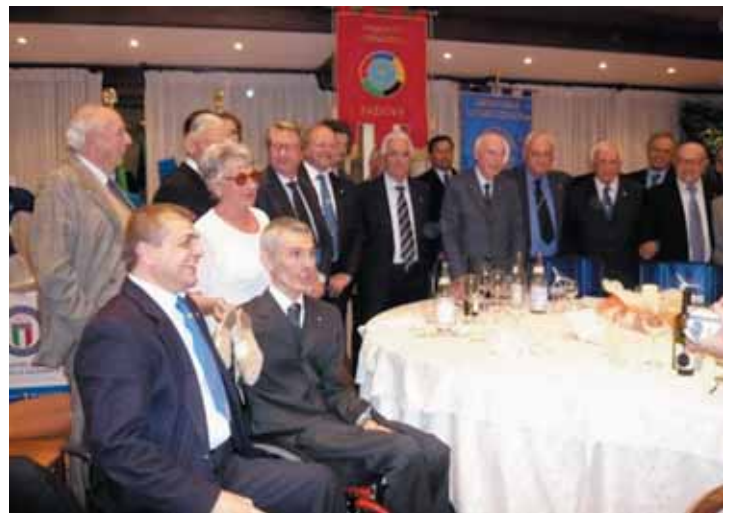
Padova. Il folto gruppo degli Azzurri patavini alla bella serata del Panathlon.