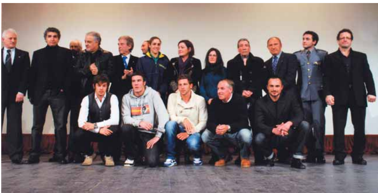
Livorno. Foto di gruppo con alcuni atleti protagonisti del filmato.