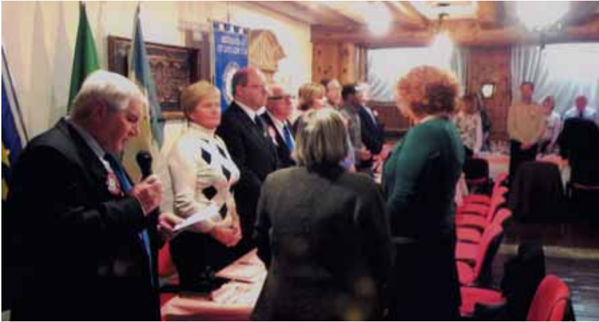
Cortina, Tutti in piedi per l'Inno Nazionale prima della bellissima serata.