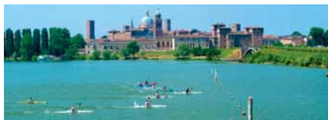
Mantova. Canoe in gara sul Lago Inferiore.

A questo punto, constatata la positività dell’esperienza internazionale, verificato il favore dei tecnici italiani e stranieri, avuta la conferma della Federazione Italiana che il Campo “Sparafucile” sarebbe rimasto il campo di prima scelta per le selezioni e gli allenamenti più importanti della squadra Azzurra (come dimostra la delibera federale istitutiva del “Centro FICK di Alta Specializzazione” presso il Centro “Sparafucile”) gli organizzatori, dopo aver adeguato le strutture del campo di gara del Lago Inferiore alle nuove disposizioni varate dall’International Canoe Federation per le Olimpiadi di Londra, dotandolo di una terza linea di partenza automatica ai 200 m., hanno deciso di lancia-