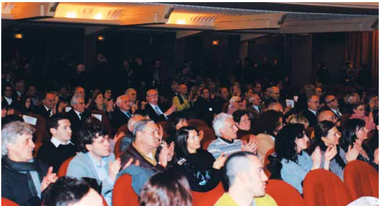
Livorno. La platea al Cinema Teatro 4 Mori.

più orgogliosi di far parte della comunità livornese e con la certezza che la nostra Associazione, con questa, abbia posto, per gli anni futuri, una pietra miliare in campo sportivo/didattico e promozionale e rappresenti un esempio positivo per i nostri giovani. (R.G.)