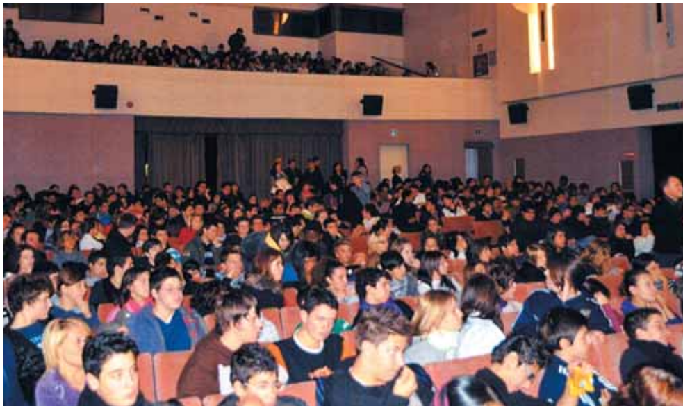
Riolo Terme (Ravenna). Il Teatro Comunale gremito di studenti.